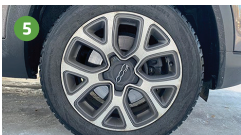
Foto sõiduki rehivist.