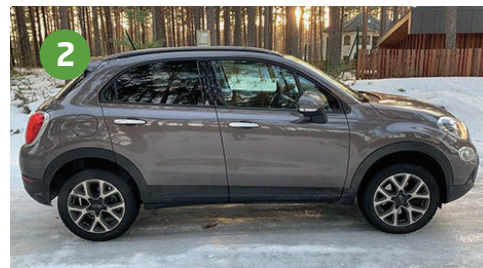
Foto sõiduki paremast küljest.