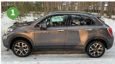
Foto sõiduki vasakust küljest.