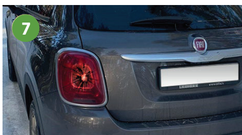
Foto sõiduki vigastustest, kui neid esineb.