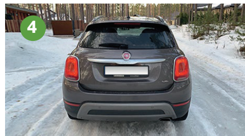
Foto sõiduki tagaküljest, millel on näha tagumine numbrimärk.