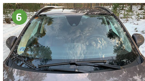
Foto sõiduki esiklaasist.