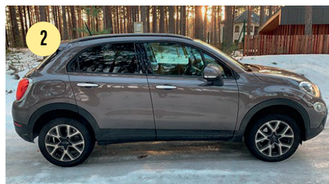
Foto sõiduki paremast küljest.