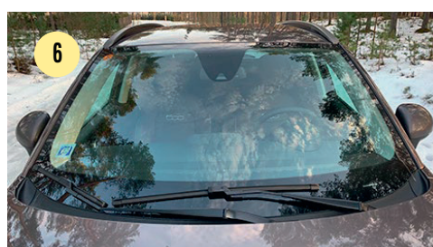
Foto sõiduki esiklaasist.