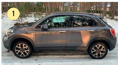
Foto sõiduki vasakust küljest.