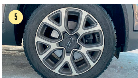
Foto sõiduki rehivist.