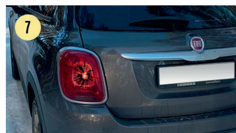
Foto sõiduki vigastustest, kui neid esineb.