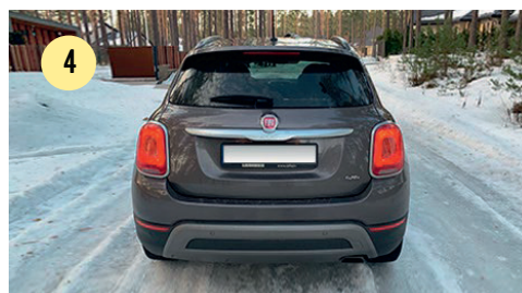
Foto sõiduki tagaküljest, millel on näha tagumine numbrimärk.